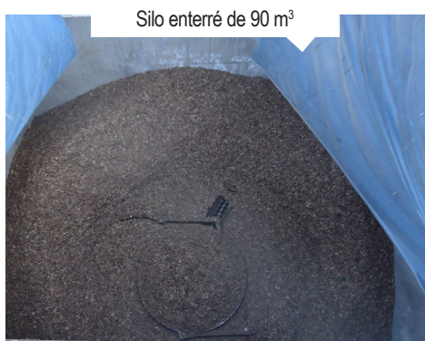
Silo enterré de 90 m 3

+ d'infos : www.planboisenergiebretagne.fr